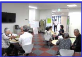
今年5月のさんでーサロンの様子

今年度新設された、毎月第3日曜日の定期交流会“さんでーサロン”ミニ講座と同時実施です。当日はがんの体験談や、女声三重唱グループ“フェリーチェ”の歌声とピアノの生演奏のコンサートもありますよ。この機会に、新しくなった“佐賀メディカルセンタービル”に遊びにきてみませんか?